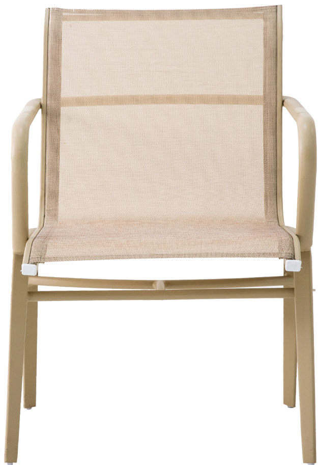
CADEIRA MICHES COLEÇÃO CARIBE